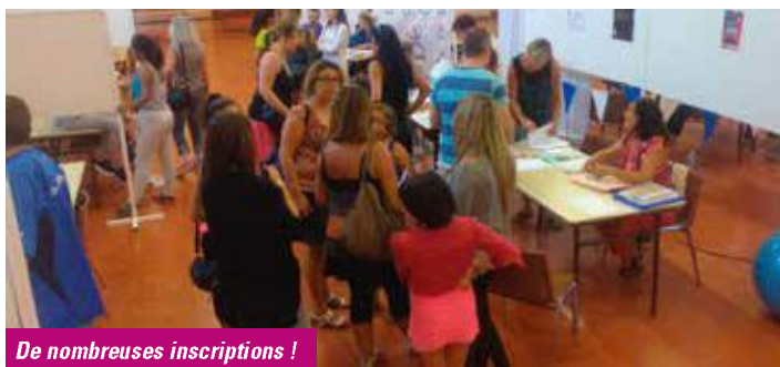
De nombreuses inscriptions !