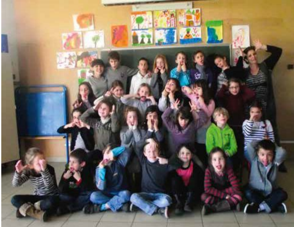
C'est la fête à la grimace !

sitôt après le repas. Tout ce stress, subi par les enfants évoluant dans des emplois du temps tracés au cordeau, n'est-il pas le mal nécessaire pour que la réforme passe ? Pour peu, on se prendrait à rechercher l'intérêt de l'enfant dans cette réforme qui semble générer surtout des contraintes d'organisation et de logistique pour chaque partenaire, sans parler des coûts.