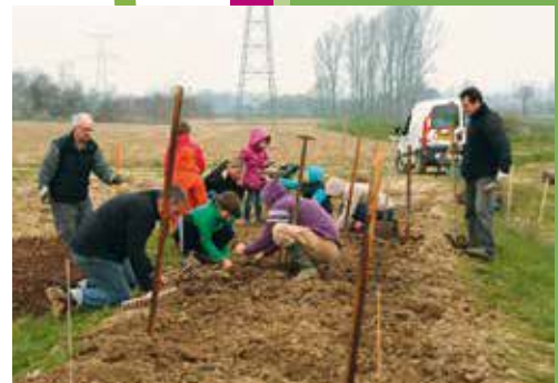
Les bénévoles, les mains dans la terre, malgré le froid