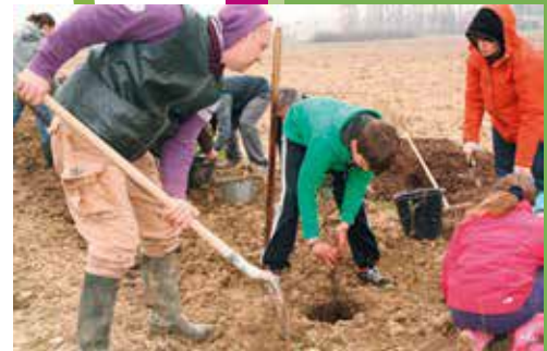
Plantation après avoir bien praliné les racines