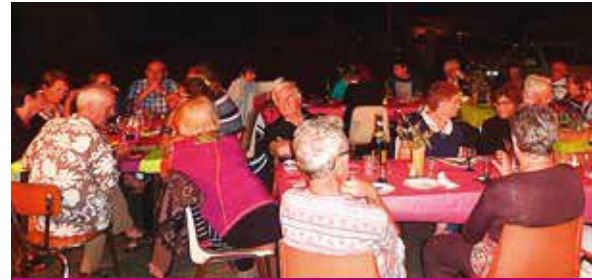
Repas des adhérents sous la voûte étoilée

Notre 25 e Salon d'Automne s'est déroulé du 24 au 28 septembre dernier. Nous avons accueilli, cette année encore, de nombreux artistes de la région Midi-Pyrénées ainsi que les participants des ateliers d'ECLA, des enfants aux adultes.