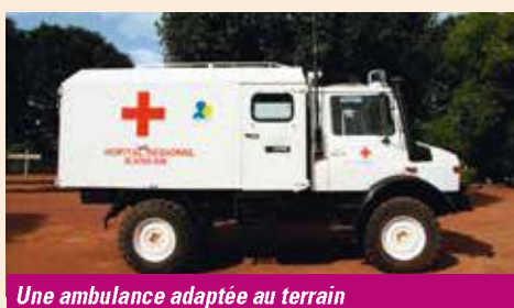
Une ambulance adaptée au terrain

Deux semaines bien remplies qui ont permis à cette équipe d'apporter au corps médical guinéen toute leur expérience et savoir-faire profession- nel mais également de ramener le souvenir d'une expérience humaine enrichissante et inoubliable.