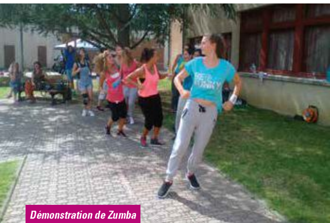
Démonstration de Zumba

Dans le souci d'encourager et de dynamiser cette rencontre, plusieurs associations ont organisé différentes initiations à leur discipline. Une autre animation gratuite a attiré, petits et grands, en leur permettant de se déplacer sur un gyropode. Habilité, équilibre... et mouvement !