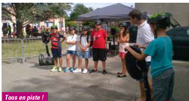
Tous en piste !