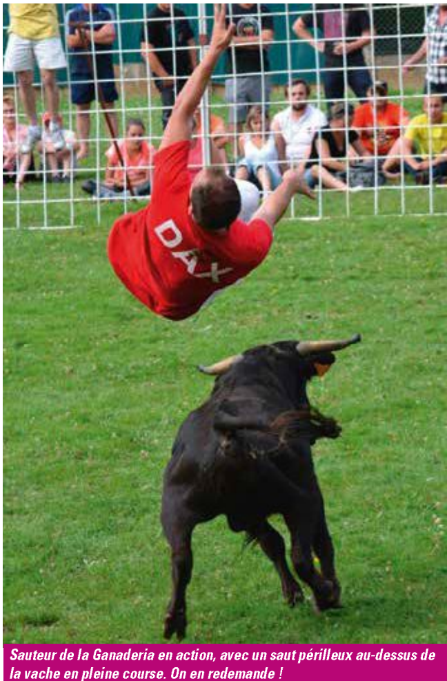
Sauteur de la Ganaderia en action, avec un saut périlleux au-dessus de la vache en pleine course. On en redemande !