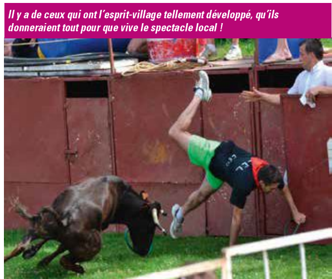
Il y a de ceux qui ont l'esprit-village tellement développé, qu'ils donneraient tout pour que vive le spectacle local !