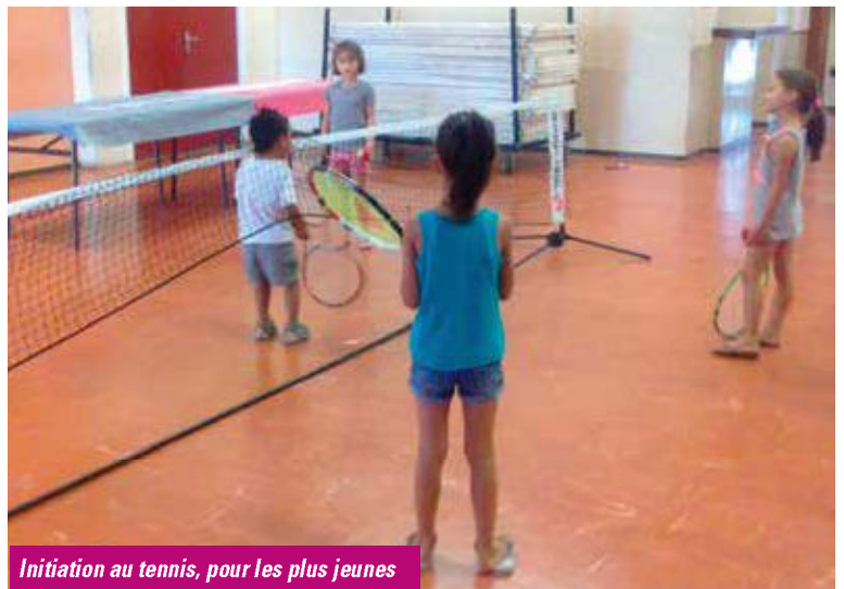
Initiation au tennis, pour les plus jeunes