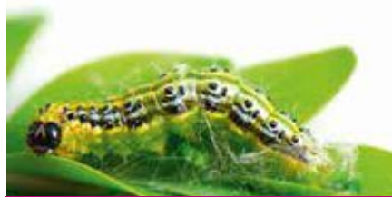
La pyrale du buis, d'abord chenille...

Il faut bien observer ses buis à partir du printemps. Le papillon pond ses larves au cœur de l'arbuste, il ne faut donc pas hésiter à regarder à l'intérieur pour voir s'il n'y a pas d'œufs ou de chenilles. La larve qui mesure environ 4 centimètres à son dernier stade, est verte avec des rangées longitudinales de points noirs et de poils drus clairs. Sa capsule céphalique est de couleur noir luisant. Elle n'est pas urticante. Les papillons sont blanc nacré avec les marges marron irisées de violet, ou inversement. La pyrale du buis mesure entre 3,5 et 4 cm au dernier stade.