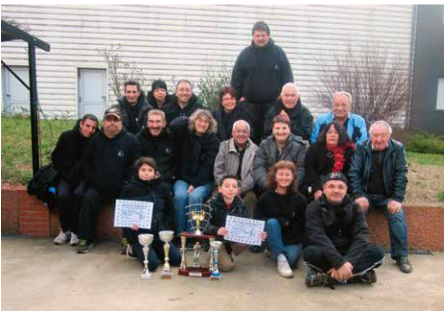
Finale des concours de l'intercommunalité 2014 à Castelmaurou

Comme tous les ans, l'assemblée générale devrait se tenir fin novembre. Cette réunion donnera l'occasion de faire le bilan et renouveler les licences pour la saison 2015. Les amateurs de pétanque rencontrés sur le dernier forum des associations y seront les bienvenus !