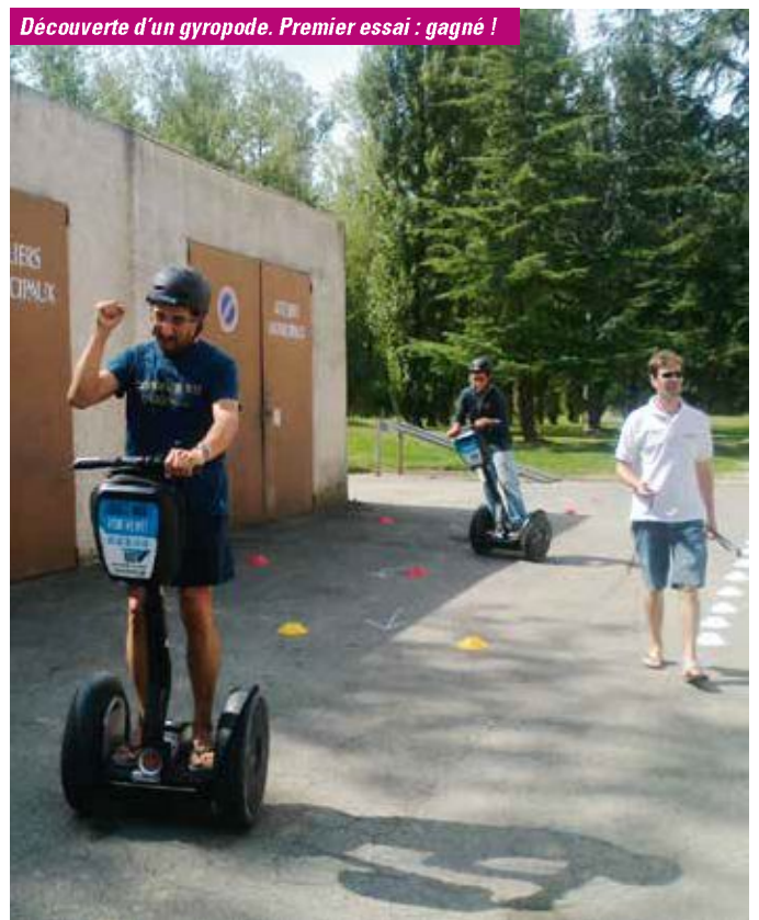
Découverte d'un gyropode. Premier essai : gagné !