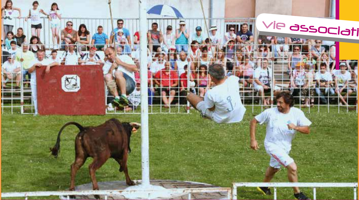
Le jeu : deux équipiers, au bout de deux cordes sur bascule, pendant qu'un troisième larron entraîne la vache. L'un monte, l'autre descend... Sinon, c'est la vache qui aura le dernier mot. Poils au dos !