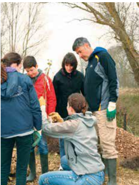
De précieux conseils prodigués par l'association Arbres et Paysages d'Autan

Dans la foulée, la commune, en partenariat avec l'association « Arbres et Paysages d'Autan », a décidé de végétaliser l'espace ainsi créé. Outre son rôle de conseil, cette association en contact avec les pépinières spécialisées dans la reconstitution forestière, a fourni les plants. Malgré des conditions météorologiques exécrables de mars, les agents du SBHG ont préparé le terrain, aidés par les agents municipaux. Ensuite, plus de 700 arbrisseaux d'espèces locales ont été plantés. Ces plantations ont été réalisées par les membres de l'Association « 1000 et un pas » et toutes les bonnes volontés que la Municipalité avait invités sous la supervision de techniciens des « Arbres et Paysages d'Autan ». Une séance dédiée aux enfants a été également organisée dans le cadre du Centre de Loisirs avec le concours d'une animatrice qui a prodigué aux jeunes tous les conseils utiles pour réussir leurs plantations. Environ trente personnes ont mis en terre les divers végétaux qui abriteront plus tard un lieu de promenade, le long de notre cours d'eau redevenu facilement accessible et plus familier. Rendez-vous donc, sous les ombrages, dans quelques années.