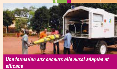
Une formation aux secours elle aussi adaptée et efficace