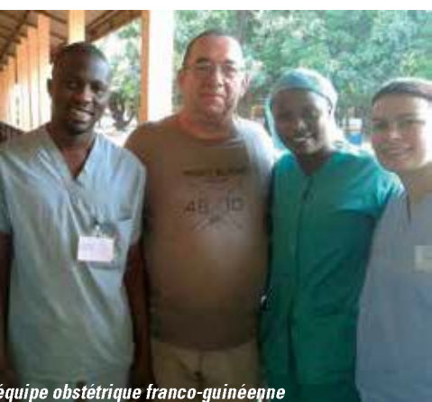
équipe obstétrique franco-guinéenne