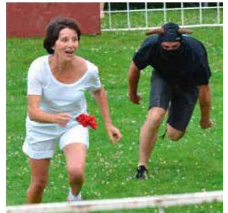
Le taureau François en piste, pour le plus grand plaisir de ces dames.