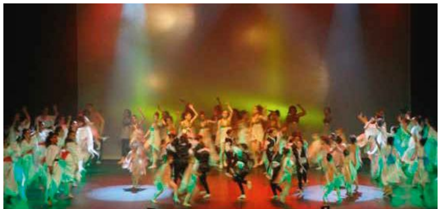
« Gala : Danse au Pays du soleil levant »

N'hésitez pas et profitez d'un premier cours d'essai gratuit les jeudis de 20 h 30 à 21 h 30.