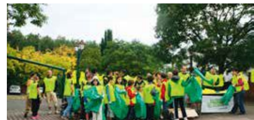
Repas des adhérents sous la voûte étoilée