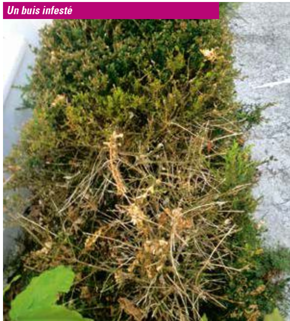
Un buis infesté