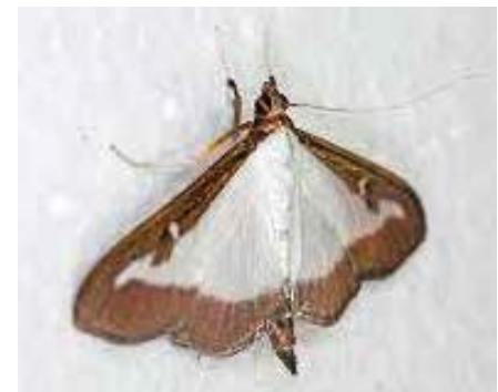
... puis papillon !

A partir de votre moteur de recherche préféré, vous pouvez suivre sur internet les évolutions des traitements.