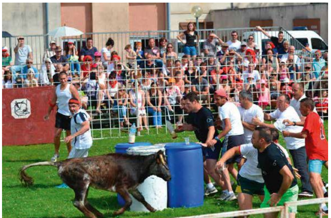
Le jeu : boire des verres de bière au centre de l'arène... tant que la vache n'y est pas. Si elle y était, tout le monde s'échapperait !