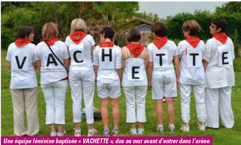
Une équipe féminine baptisée « VACHETTE », dos au mur avant d'entrer dans l'arène.

Remerciements à la Municipalité pour son aide, en attendant l'éventuelle revanche... pour les 30 ans peut-être ?!