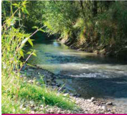
Où est-ce... ? A Labastide, sur les bords du Girou !

En début d'année, les entreprises missionnées par le SBHG, ont remanié les berges sur environ 400 m, au lieu dit « Le Not », créant du côté du cours d'eau, des accès doux vers les rives. En effet, les crues successives avaient provoqué des effondrements des berges rendant le bord du cours d'eau inaccessible et dangereux. Des merlons de terre ont également été créés pour rehausser la berge du côté