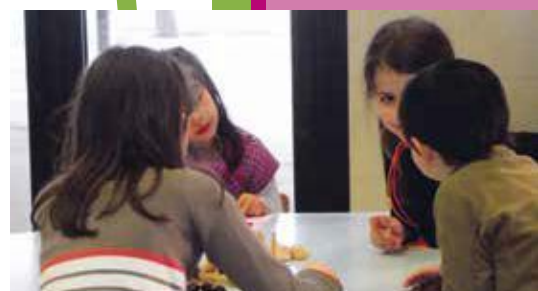
Jeu de société

Il est fort possible que les choses évoluent encore, en fonction des retours d'expérience qui seront faits. Pour notre part, nous avons déposé un Projet Éducatif Territorial couvrant une période d'un an au terme de laquelle un bilan devra être fait. Ainsi, nous pourrons plus facilement dégager les mesures correctives nécessaires pour les années suivantes.