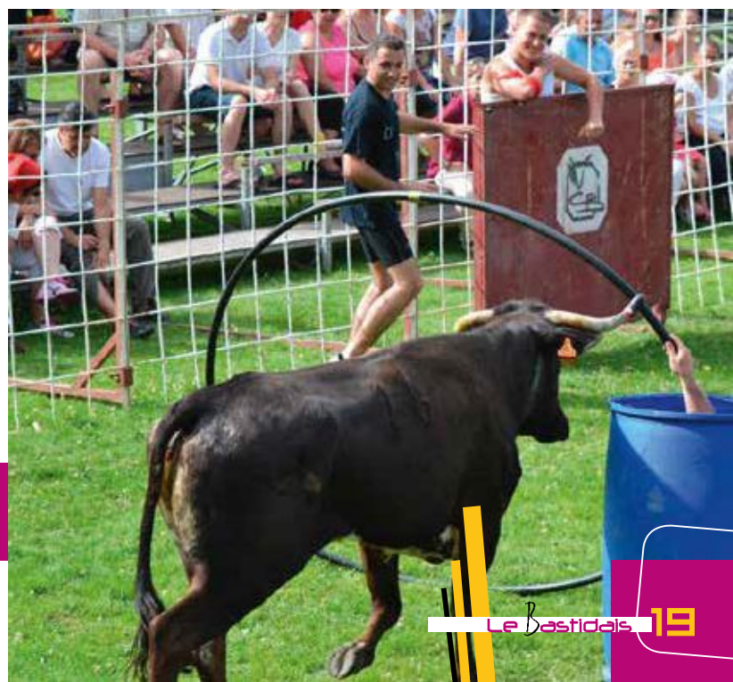
Le jeu : Attirer la vache pour la faire passer dans le cerceau. Deux équipiers : un dans le tonneau... mais l'autre ? Il devait tenir le cerceau !